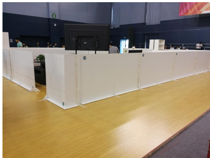
图 2 四周各加装 2 米