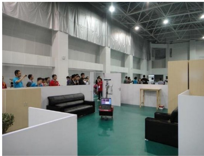
图 1 大赛实拍图

图 1 为往届大赛实地拍摄图，图 2 为场地四周各加装 2 米地板与场内一致，供参考。