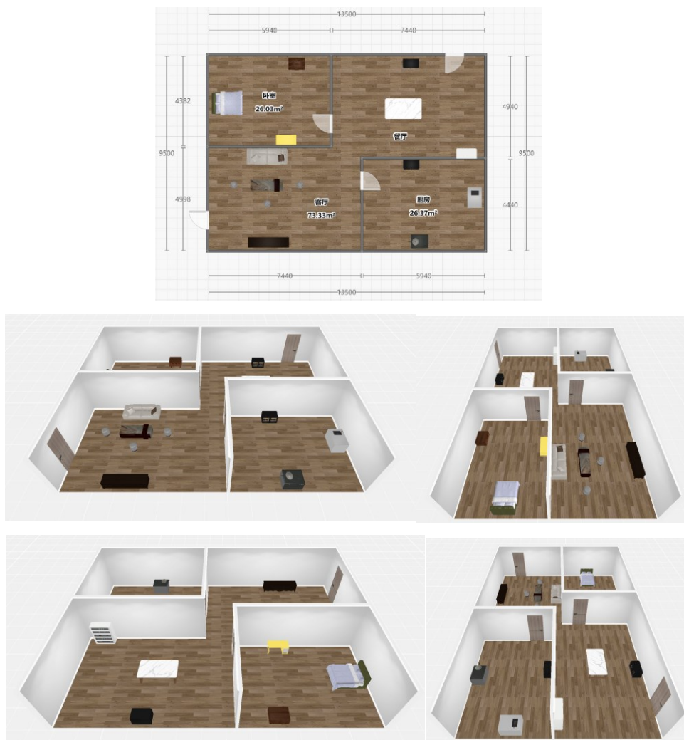
图 5 3D 示意图

另外, 门的尺寸: 宽度 0.9 米, 高度不限。以上所有摆设的尺寸均为建议尺寸, 承办方可根据实际情况调整, 最好接近建议的尺寸, 以便机器人能在房间中自如的行走, 但是所有摆设的高度最好与建议的相差不要太大, 方便机器人对物体的操作。