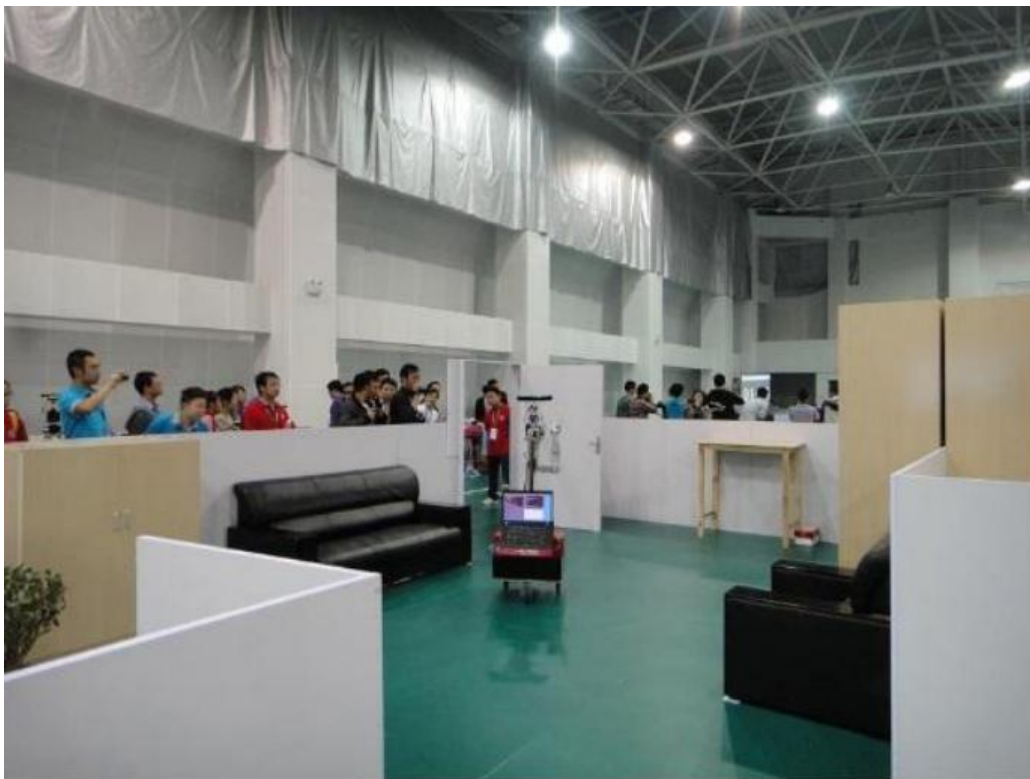
图 1 大赛实拍图