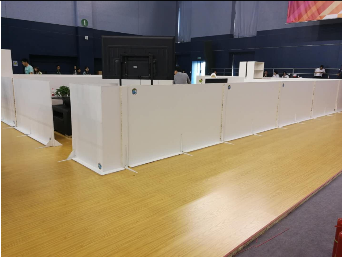
图 2 四周各加装 2 米