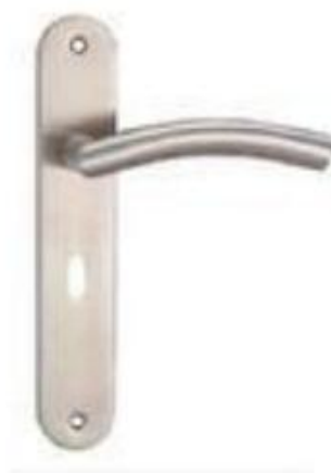
图 3 门把手