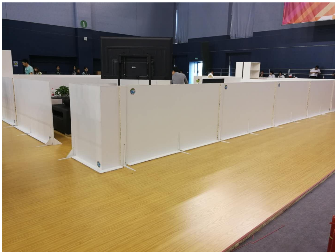
图 2 四周各加装 2 米