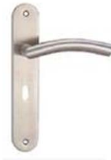
图 2 门把手