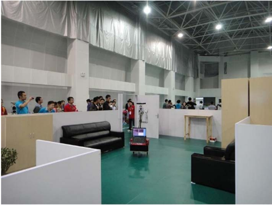
图 1 大赛实拍图